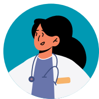
Médecin de Médecine Physique et Réadaptation

L'équipe est composée de professionnels issus du Centre de Réadaptation d'Oléron à Saint-Trojan-les-Bains et du service de MPR du Groupe Hospitalier Saintes - Saint-Jean-d'Angély.