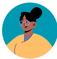
Assistant de service social